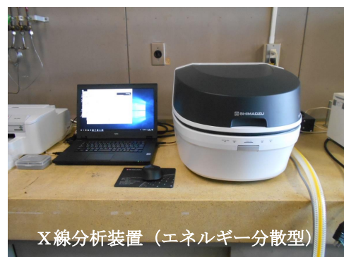
X線分析装置（エネルギー分散型）