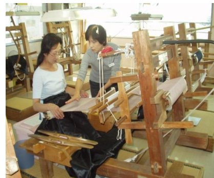
地機織りの指導を受ける伝習生