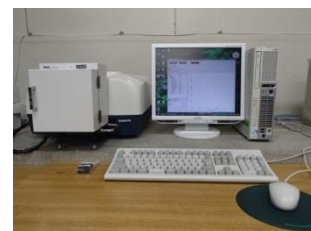
自記分光光度計 日本分光 V-670DS