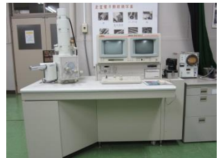
走査型電子顕微鏡 日本電子 JSM-5310LV