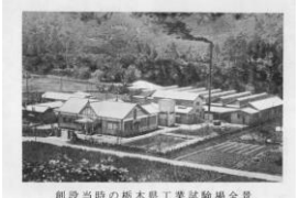
創設当時の栃木県工業試験場全景 ※創立六十周年記念誌「栃木県繊維工業試験場(1985)より引用