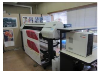
開放している機器の一例