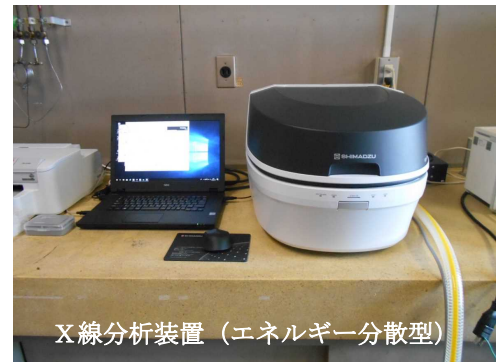
X線分析装置（エネルギー分散型）