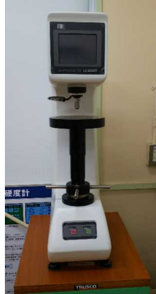
ロックウェル硬さ試験機

金属組織観察や硬さ測定などの試験片作製のため、材料や部品等を適切な大きさに切断する装置。