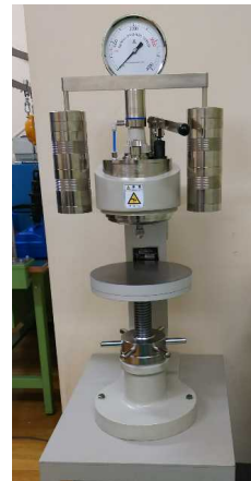
ブリネル硬さ試験機

JISに規定されているロックウェル硬さ試験方法により、金属やプラスチック等の硬さを測定する装置。